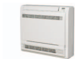
Unidade interior FVXS25,35,50F