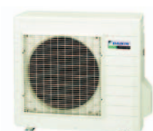
Unidade exterior RXS50J