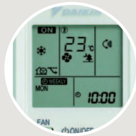
Controlo remoto por infravermelhos (de série) ARC452A1