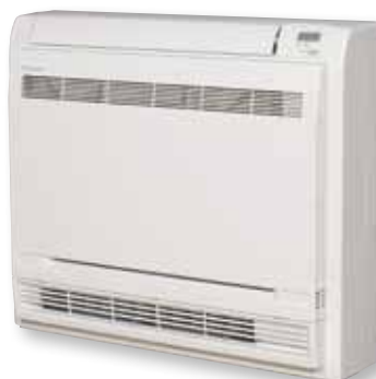
Convector para bomba de calor

O sistema Daikin Altherma é compatível com todos os tipos de emissores de calor, como aquecimento por pavimento radiante, radiadores e unidades ventilo-convectors, mas a solução ideal é o convector para bomba de calor que é muito mais do que uma unidade ventilo-convectiva ou qualquer outro emissor de calor. Este pode fornecer aquecimento e se necessário, arrefecimento, melhorando a eficiência energética da instalação em aproximadamente 25% quando ligado a um sistema de baixa temperatura Daikin Altherma, em combinação com pavimento radiante.