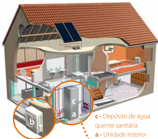
b - Unidade exterior

* COP (Coeficiente de Performance) até 4,56