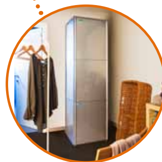
Novo modelo de chão